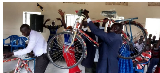
세상을 그리스도께로 연결하는 브릿지 교회 선교팀